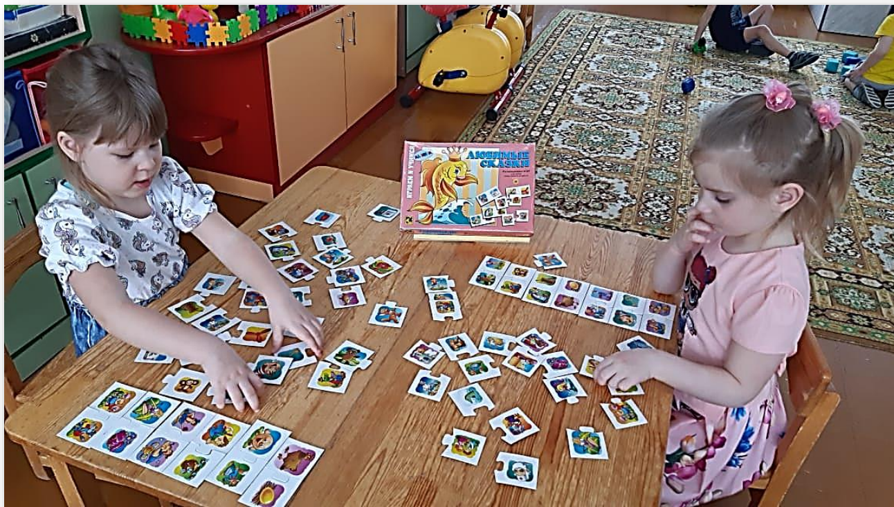
Д/игра «Любимые сказки»