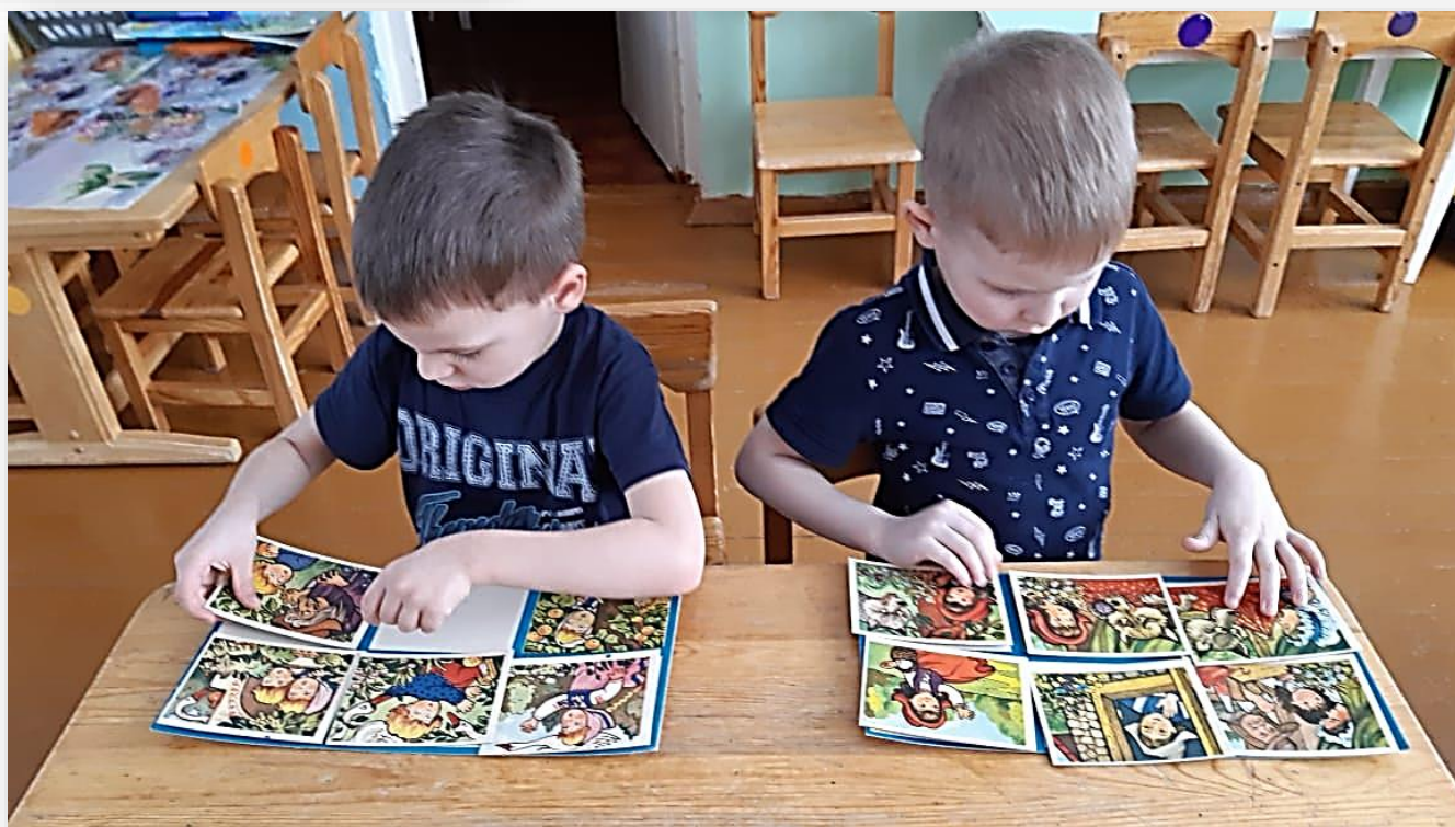
Д/игра «Разложи по порядку и расскажи сказку»