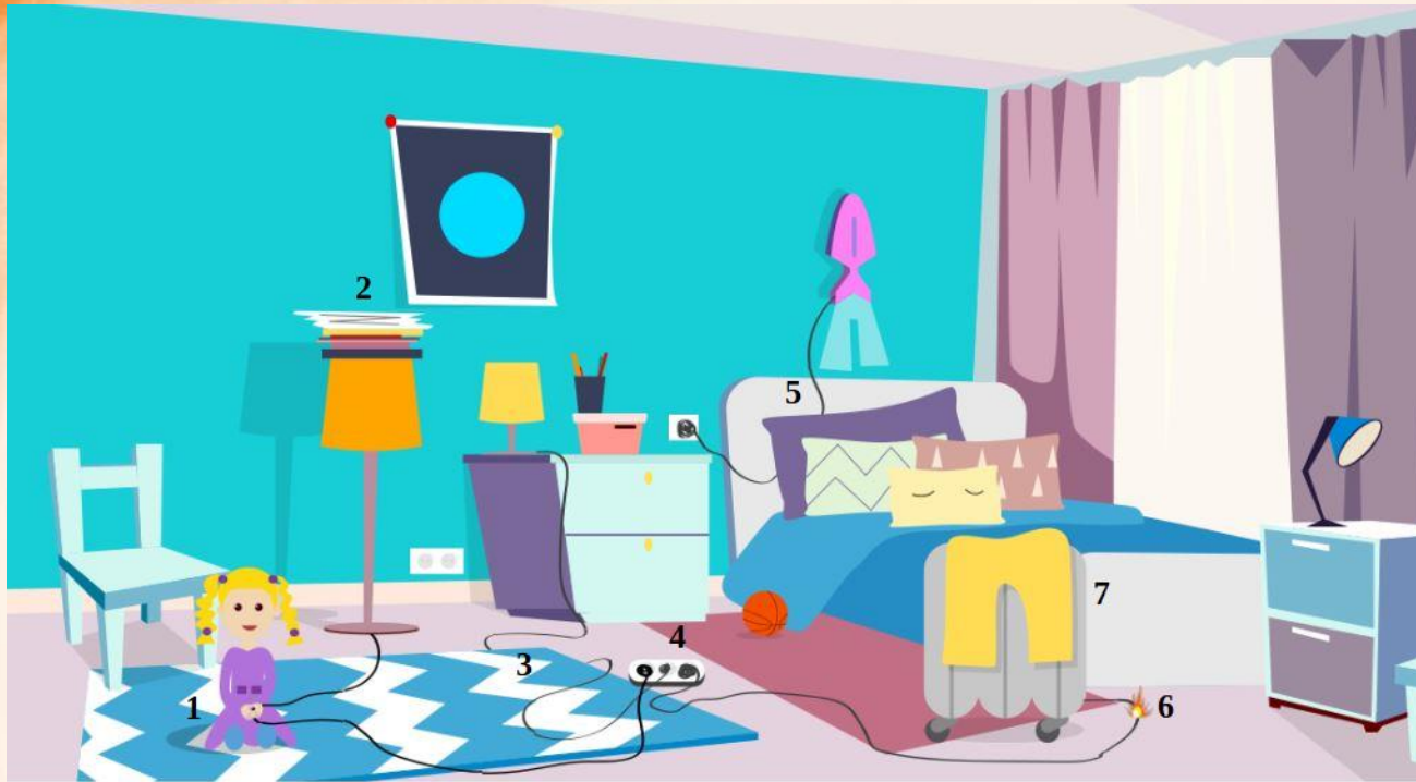
Рис. 5 Проверь найденные нарушения пожарной безопасности в детской