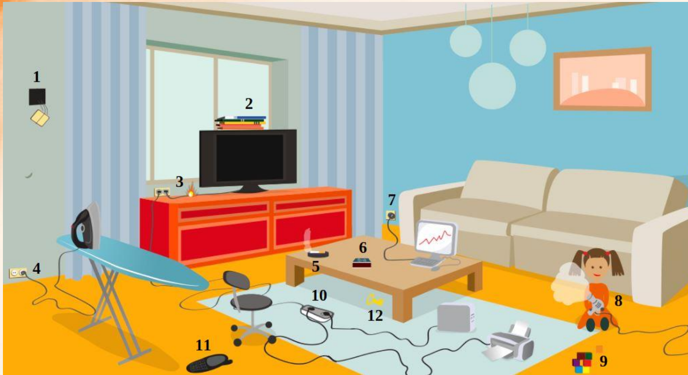
Рис. 3 Проверь найденные нарушения пожарной безопасности в гостиной