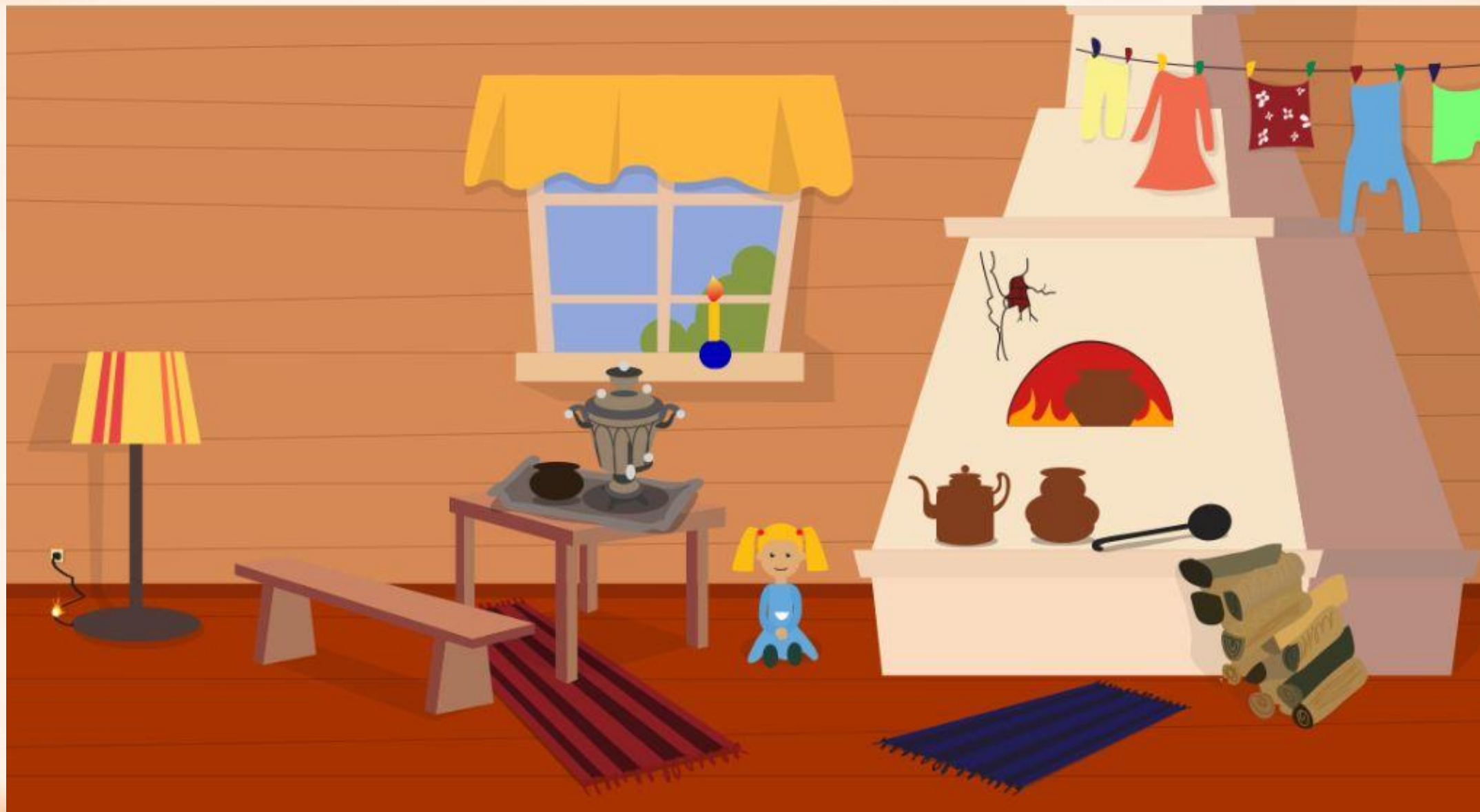
Рис. 1 Найди нарушения пожарной безопасности в доме (8 нарушений)