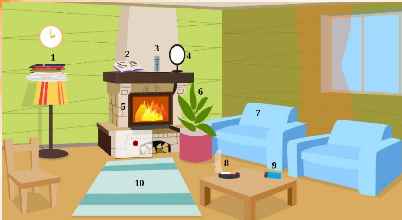
Рис. 4 Проверь найденные нарушения пожарной безопасности в гостиной