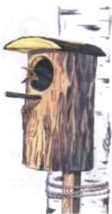
Скворец на скворечнике. (В)

7. Упражнение «Исправь ошибки»: Рассмотрите картинки. Послушайте предложения и исправьте ошибки.