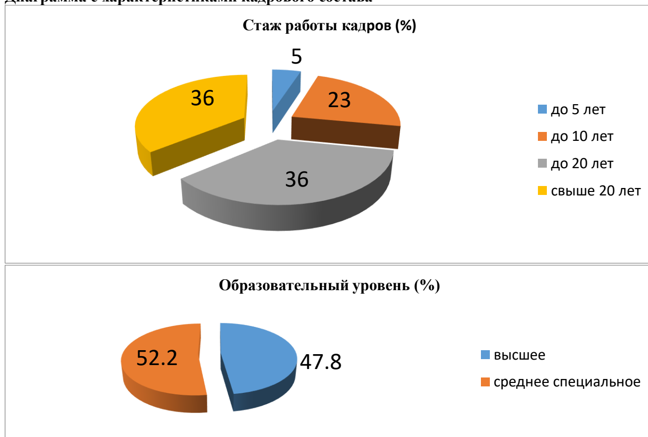
Диаграмма с характеристиками кадрового состава

В 2021 году педагоги Детского сада приняли участие: