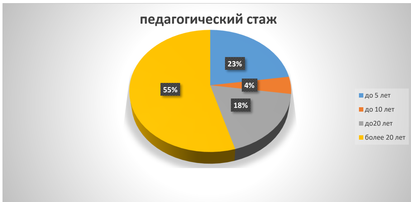
Диаграмма с характеристиками педагогического состава

Курсы повышения квалификации в 2025 году прошли 21 работник Учреждения, из них 21 педагогов.